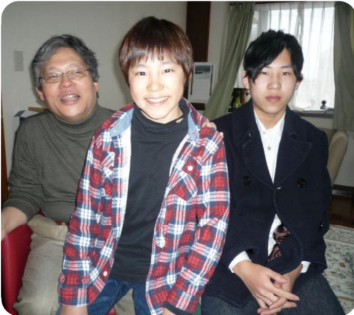
まあちゃんお宅訪問

海に入っちゃうヤツ、走り回るヤツ：僕は友だちと穴掘り！海水が冷たいけど、どんどん掘ってたら貝が出てきたよ☆何だかラッキー☆ 二十日に卒業式：大好きな木登りともお別れかあ・・・ 四月七日、僕は中学生になる！ 僕らは内部進学だけど、あとの半分は外部からの受験者だ。沢山友だち出来るかな!?