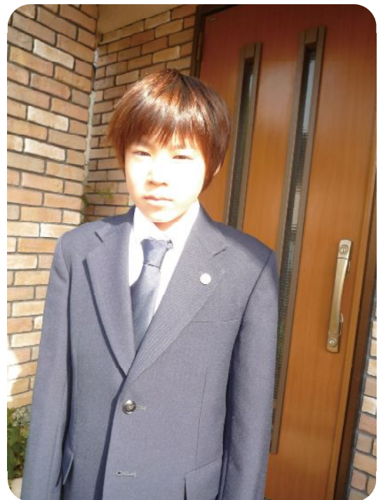
まだ少し大きい制服

海に入っちゃうヤツ、走り回るヤツ：僕は友だちと穴掘り！海水が冷たいけど、どんどん掘ってたら貝が出てきたよ☆何だかラッキー☆ 二十日に卒業式：大好きな木登りともお別れかあ・・・ 四月七日、僕は中学生になる！ 僕らは内部進学だけど、あとの半分は外部からの受験者だ。沢山友だち出来るかな!?